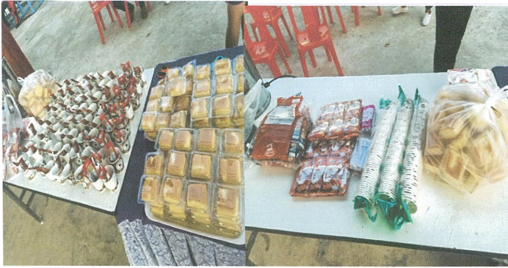
อาหารกลางวัน