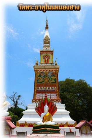
วัดพระธาตุในหนองสูง