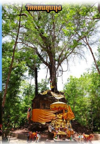
วัดคอนอุบุง