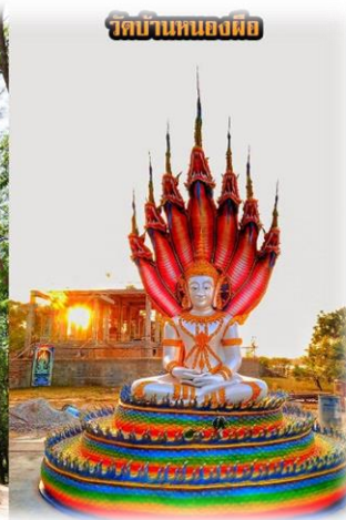
วัดบ้านหนองผือ